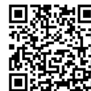
Guia em Inglês