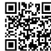
《巴西营商指南》英文